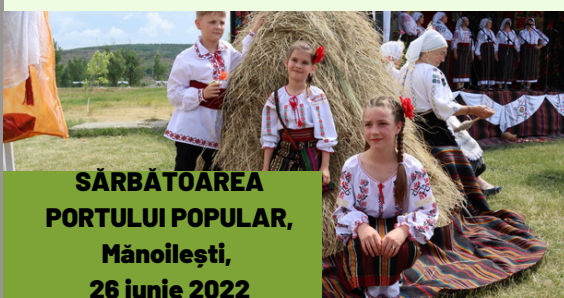
SĂRBĂTOAREA PORTULUI POPULAR, Mănoilești, 26 iunie 2022

Satul Mănoilești a devenit destinația, unde și-au dat întâlnire Frumusețea, Tradiția, Emoția, Voia Bună și toate la un loc. Evenimentul a contribuit la etalarea a tot ce are mai prețios raionul Ungheni: Valoarea, Talentul, Măiestria OAMENILOR care-și prețuiesc Rădăcinile, Pragul Casei Părintești, Haina Neamului.