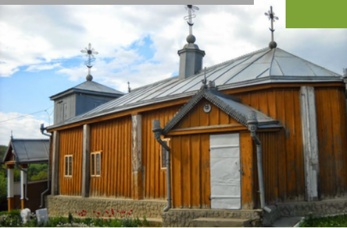
Biserica „Sf. Arh. Mihail și Gavriil” din satul Teșcureni

Biserica „Sf. Arh. Mihail și Gavriil” din satul Teșcureni, înălțată în anul 1779, este situată pe o coastă de deal în partea de nord a satului. Biserica din lemn poartă semnele unui monument veritabil de istorie creștină în formă de corabie. Este luată sub ocrotire de stat, ca una din cele mai vechi biserici din lemn (de importanță republicană).