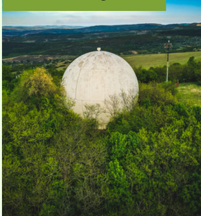
Sfera, com. Boghenii Noi

MOVILA MĂGURA, cu înălțime de 14 metri, se află pe un deal, iar altitudinea absolută a acesteia este de 388 metri, situându-se pe locul doi după mărime în Republica Moldova, după dealul Bălăneștiului.