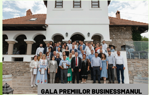
GALA PREMIILOR BUSINESSMANUL ANULUI 2021, EDIȚIA XXI, Crama Mircești, 10 iunie 2022

Albumul „Ungheni - amprenta vie a frumuseții”, un proiect comun, realizat de Secția Culturală Ungheni și Muzeul de Istorie și Etnografie Ungheni. În cele 120 de pagini se regăsesc date din istoria acestui meleag, informații despre tradiții, datini și obiceiuri, despre locurile ce merită să fie vizitate. Albumul este unic de acest gen și reprezintă cartea de vizită a raionului.