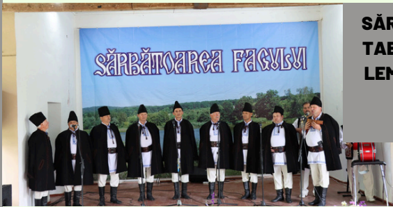
SĂRBĂTOAREA FAGULUI și TABĂRA CIOPLITORILOR ÎN LEMN, Rezervația Naturală “Plaiul Fagului”, 23-29 mai 2022

Freamăt de codru, corovatic, expoziții, cântece, voie bună... și multe altele au fost propuse vizitatorilor la Sărbătoarea Fagului, organizată în Rezervația Naturală “Plaiul Fagului”. Atmosfera de sărbătoare a fost garantată de formații artistice, de cei mai talentați meșteri, iar cei care au dorit să regăsească gustul copilăriei au avut parte de degustări cu bucate tradiționale.