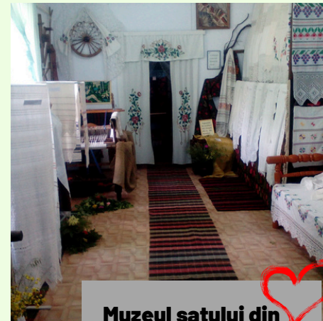
Muzeul satului din localitatea Pîrlița

Muzeul comunei Pîrlița prezintă atât istoria localității, cât și etnografia acesteia. Un interes deosebit prezintă cele două case țărănești, specifice localității, precum și scoarțele, covoarele, prosoapele, mobilierul țăranesc, dar și documentele, cărțile și fotografiile de epocă, expuse în cadrul expozițiilor temporare.