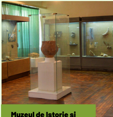
Muzeul de Istorie și Etnografie Ungheni

Colecțiile Muzeului de Istorie și Etnografie includ peste 10 000 de piese autentice cu o anumită valoare istorică și culturală. Colecțiile de arheologie, populară, țesături tradiționale și ceramică sunt pline de relevanță și originalitate. Ele ajung să fie imaginea regiunii din cele mai vechi timpuri până astăzi.