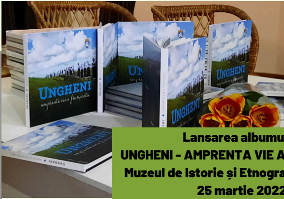
Lansarea albumului UNGHENI - AMPRENTA VIE A FRUMUSEȚII, Muzeul de Istorie și Etnografie Ungheni, 25 martie 2022

Albumul „Ungheni - amprenta vie a frumuseții”, un proiect comun, realizat de Secția Culturală Ungheni și Muzeul de Istorie și Etnografie Ungheni. În cele 120 de pagini se regăsesc date din istoria acestui meleag, informații despre tradiții, datini și obiceiuri, despre locurile ce merită să fie vizitate. Albumul este unic de acest gen și reprezintă cartea de vizită a raionului.