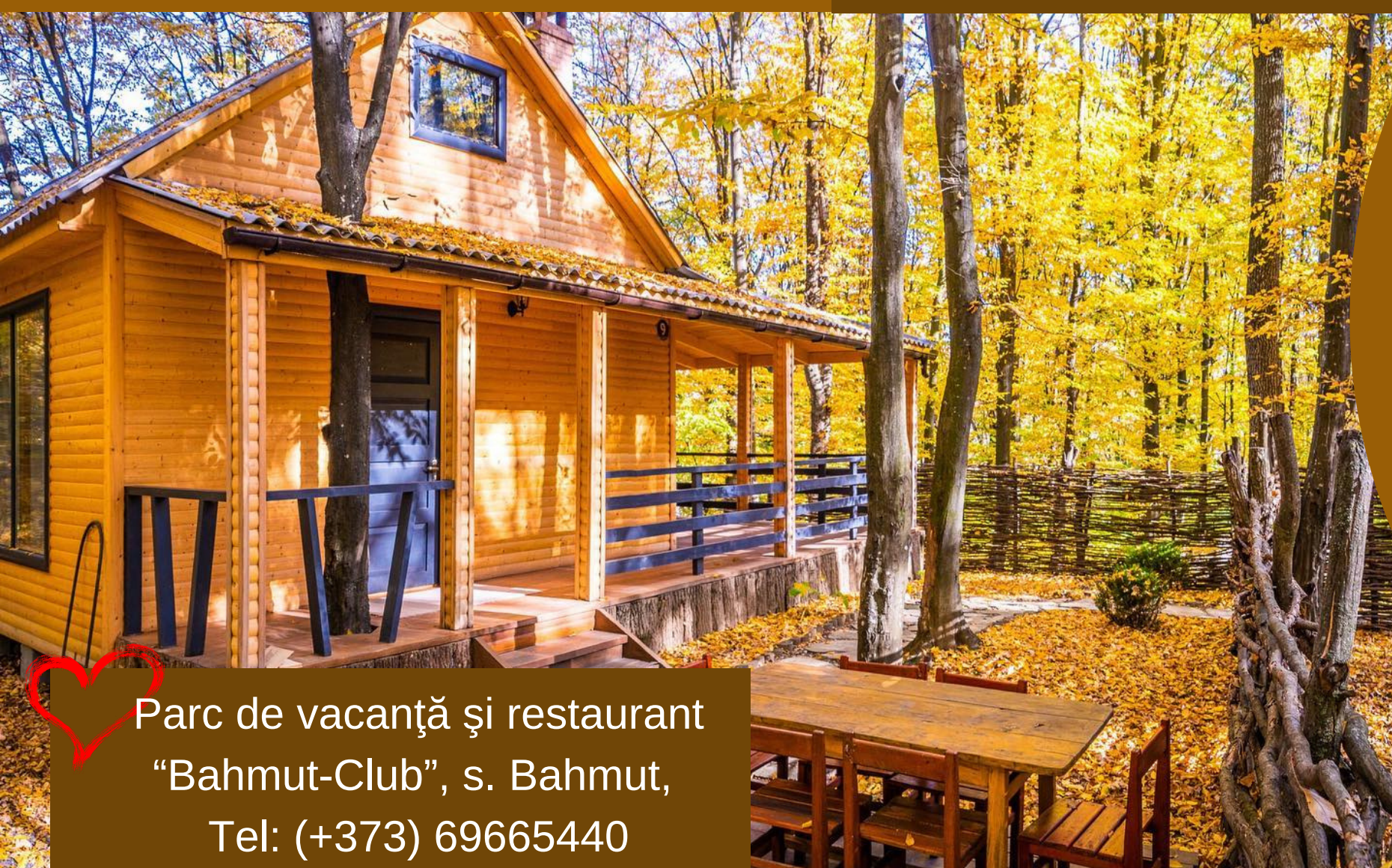
Parc de vacanță și restaurant "Bahmut-Club", s. Bahmut, Tel: (+373) 69665440

La „ BAHMUT-CLUB ”, situat în codrii seculari ai Călărașilor, descoperim o părticică din Moldova tradițională și modernă în același timp. Un colț de rai învăluit în liniște și aer curat oferă relaxare maximă, în condiții prielnice de cazare atât vara, cât și iarna. „BAHMUT-CLUB” este și o posibilitate de organizare a seminarelor, trainingurilor și altor activități profesionale.