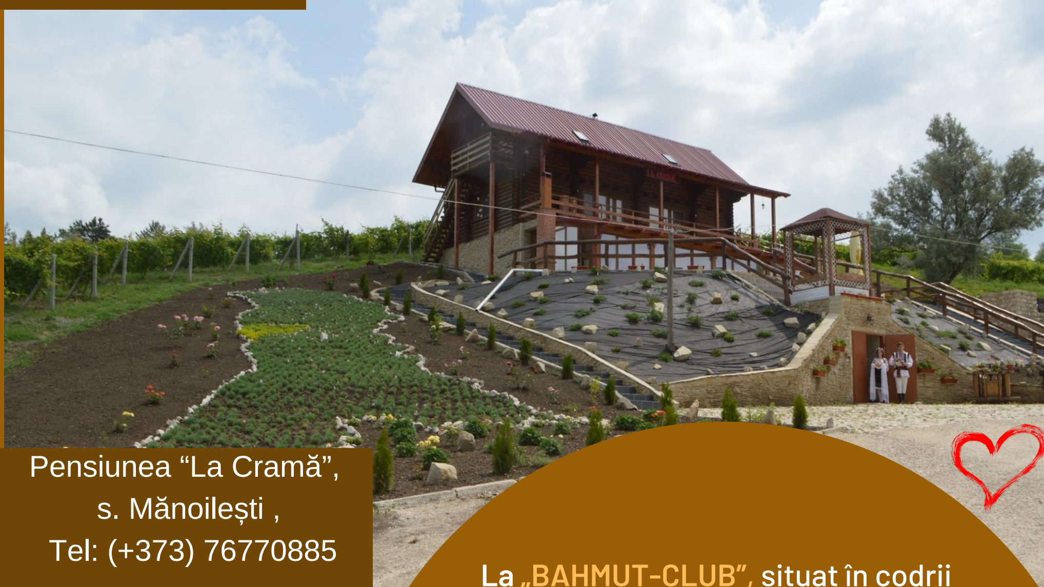
Pensiunea "La Cramă", s. Mănoilești, Tel: (+373) 76770885

La „ BAHMUT-CLUB ”, situat în codrii seculari ai Călărașilor, descoperim o părticică din Moldova tradițională și modernă în același timp. Un colț de rai învăluit în liniște și aer curat oferă relaxare maximă, în condiții prielnice de cazare atât vara, cât și iarna. „BAHMUT-CLUB” este și o posibilitate de organizare a seminarelor, trainingurilor și altor activități profesionale.