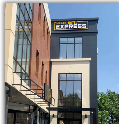
Hotel "Urban Hotel Express", Tel: (+373)60888009