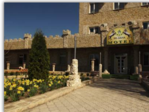
Motel și restaurant "Iri-Dana", Tel: (+373) 23630202