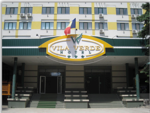
Hotel "Vila Verde Ungheni", Tel: (+373) 23623399